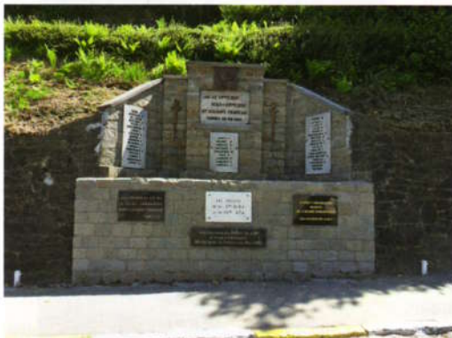
Monument français

C'est à l'initiative de la section des anciens prisonniers de guerre que ce monument a été élevé à la mémoire des 43 officiers, sous-officiers et soldats français, tombés sur le territoire de la commune de Court-Saint-Étienne lors des combats de mai 1940. Inauguré le 13 mai 1956, le monument en grès de Meuse est dû à l'architecte Gaston Delbrassine (Tilly 1923 - Charleroi 1981). Le monument a été complété (ajout de plaques commémoratives) et inauguré une seconde fois le 13 mai 1962.