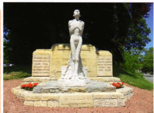
Monument aux Victimes civiles du Nazisme