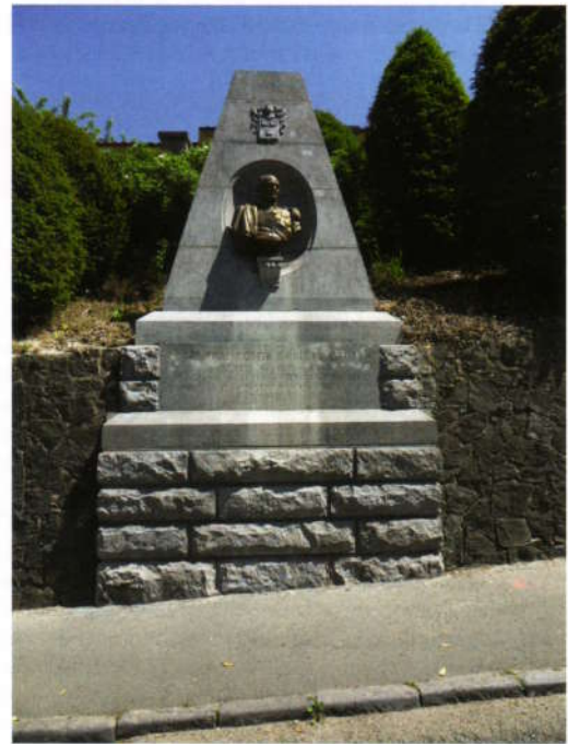
Monument du Lieutenant-général Comte Albert Goblet d'Alviella